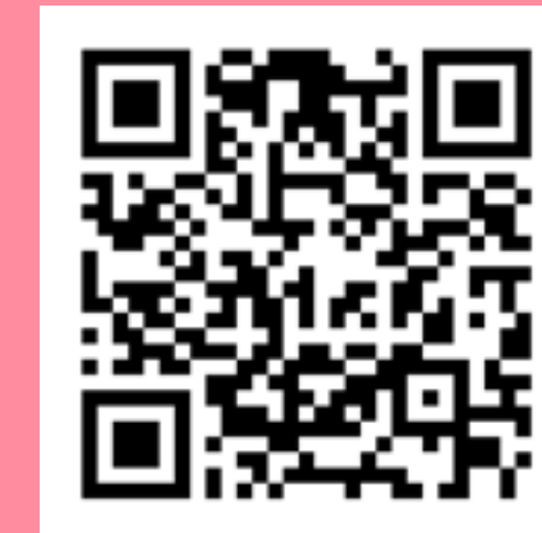
Seriál Rakouskem svobodně a aktivně