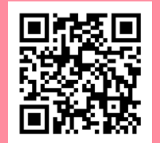
Podcast Kousek Rakouska